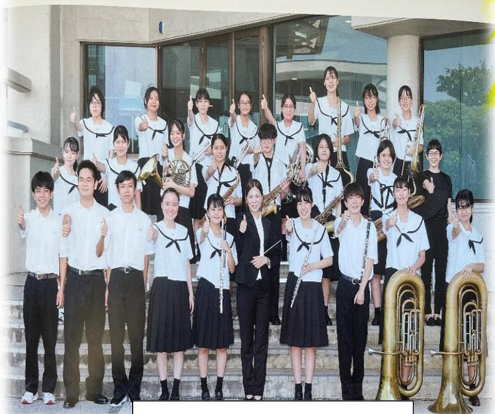
糸満高校 吹奏楽部